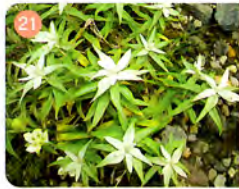
21 ミナクスユキソウ