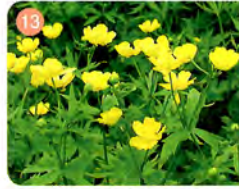
13 ミヤマキンポウゲ