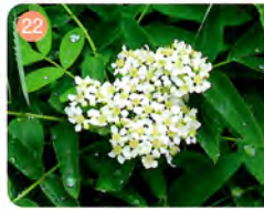
22 ウラジロナナカマド