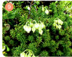
9 アオノツガザクラ