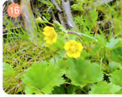
16 ミヤマタイコロソウ