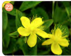
23 シナノオトギリソウ

(信濃弟草)オトギリソウ科/秘密を洩した弟を兄が切ったという伝説から付けられた。