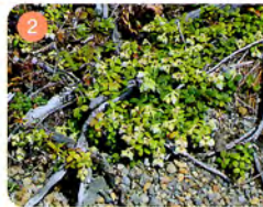
2 コメバツガザクラ