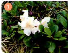
1 キバナシククナゲ

●「大黒岳」「富士見岳」「魔王岳」「剣ヶ峰(頂上)」の4山のみ登山できます。 ●お花畑は木道から降りないでください。●ロープを超えないでください。